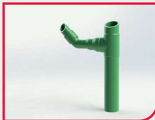
Sistema PP-RCT d20-315 mm