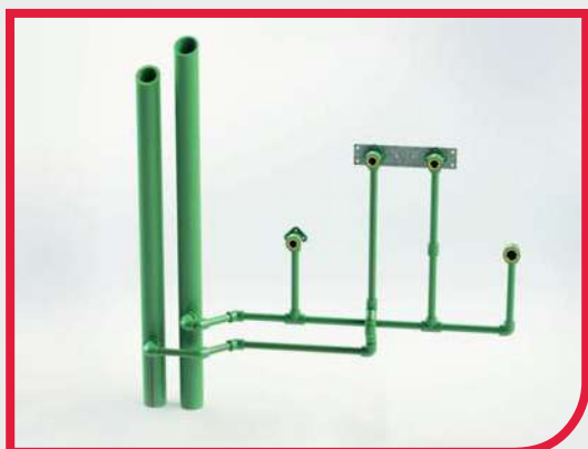
Sistema PP-R d20-125 mm

Polysan/Wefatherm ofrece dos sistemas de distribución de agua, montantes y horizontales de distribución.